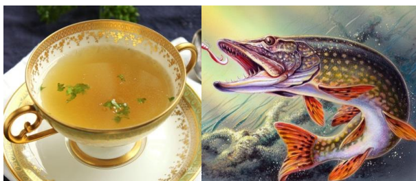
Юшка з риби.